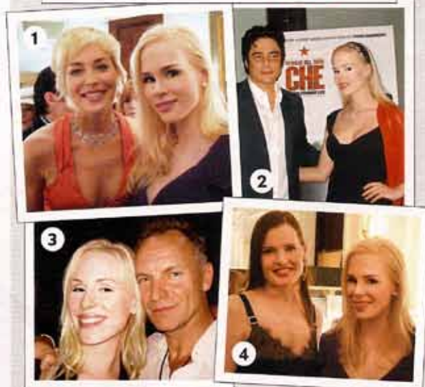
1 Ariane Sommer mit Sharon Stone beim Pre-Oscar-Cocktail 2008 2 Mit Benicio del Toro bei der „Che“-Premiere 2008 3 Mit Sting beim Tribeca-Festival 2006 4 Mit Geena Davis 2008