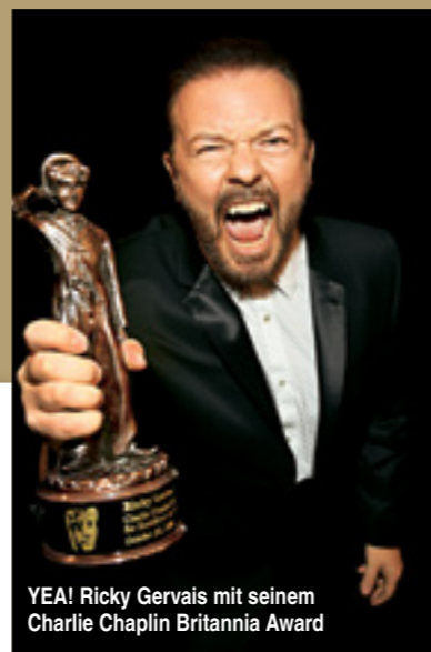
YEA! Ricky Gervais mit seinem Charlie Chaplin Britannia Award