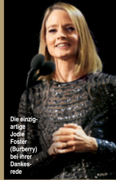
Die einzig-artige Jodie Foster (Burberry) bei ihrer Dankesrede