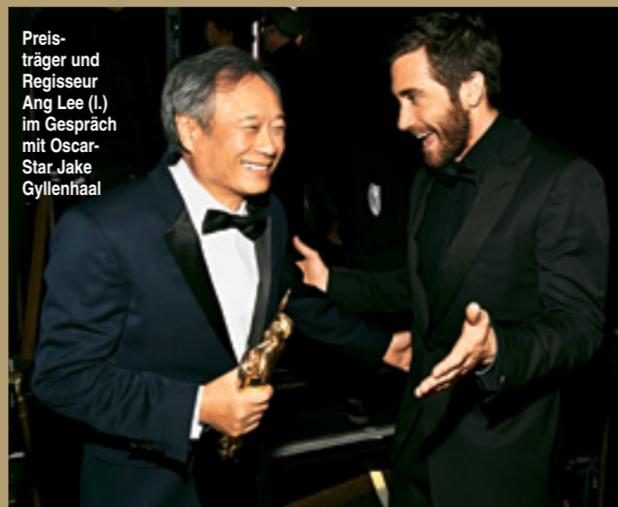
Preis-träger und Regisseur Ang Lee (l.) im Gespräch mit Oscar-Star Jake Gyllenhaal