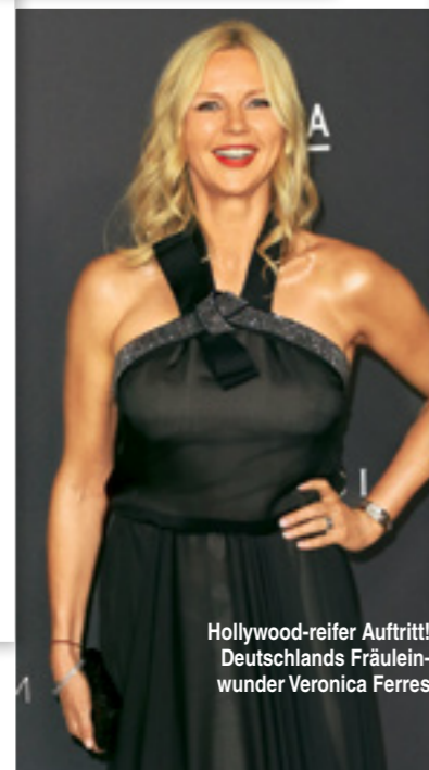
Hollywood-reifer Auftritt! Deutschlands Fräuleinwunder Veronica Ferres