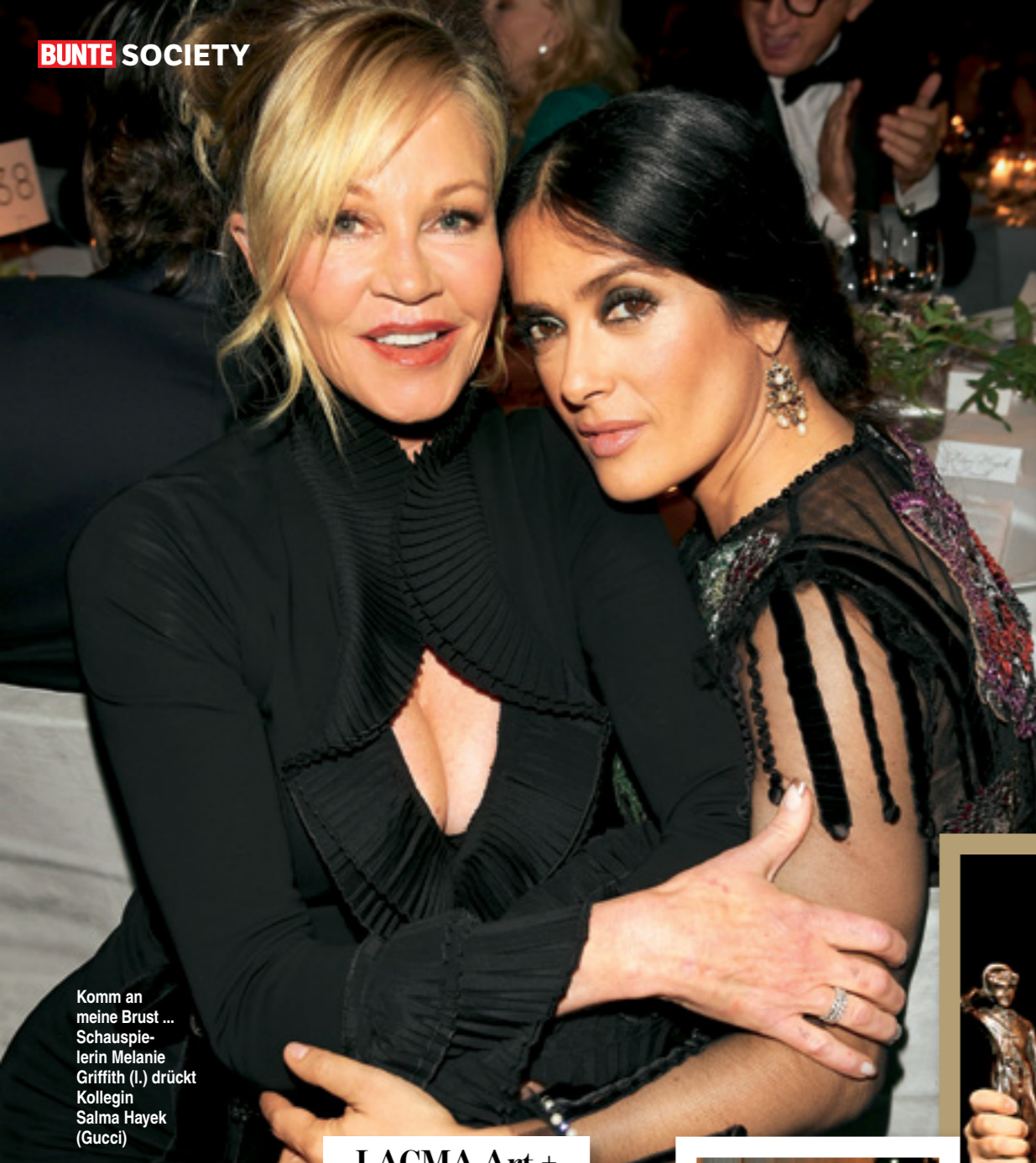
Komm an meine Brust ... Schauspielerin Melanie Griffith (l.) drückt Kollegin Salma Hayek (Gucci)